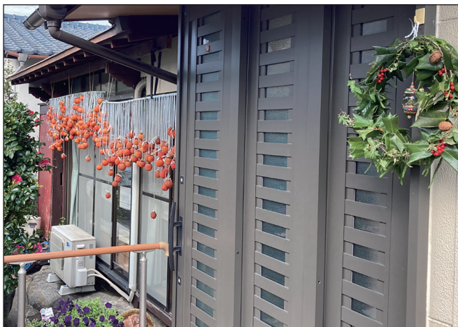
▲ミナミ・デイサービスの皆さんの作品