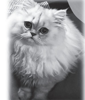
本部への投稿お待ちしております