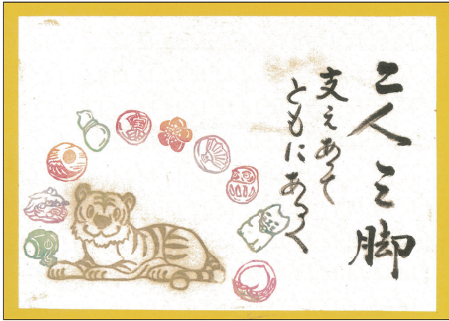
▲ほのほの消しゴム版画作品(版:加治美千代 字:鶴田輝子)