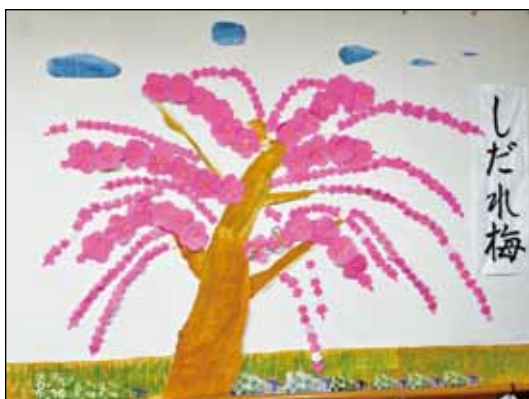
▲ミナミ・デイサービスの皆さんの作品