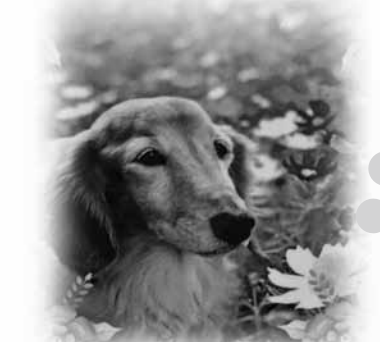
本部への投稿お待ちしております