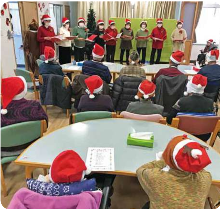
昨年12月に行われた、ふくし生協福津事業所の第2たんぽぽ(デイサービス)クリスマス会の様子。ご近所のうたごえ合唱団の方々やご利用者様のお孫さんのギター演奏なども披露されました。このように、福津事業所では季節に合わせた行事を定例で開催し、ご利用者様も職員も笑顔で過ごせる工夫をこらしています。