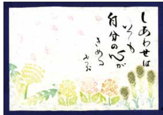
ほのぼの消しゴム版画作品(版:加治美千代 字:鶴田輝子)