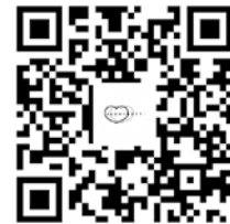
プレゼント企画HP QRコード

ふくし生協のホームページにプレゼント企画のコーナーがあります。組合員ならどなたでも応募できます。 ぜひ、ふくし生協のホームページをご覧ください。