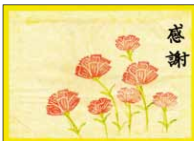
ほのぼの消しゴム版画作品(版:加治美千代 字:鶴田輝子)