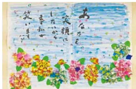
▲西南事業所宅老所「原さん家」の作品

母の日は 争う如く プレゼント ふけゆく我が身 受け入れぬ子等 気掛りの 床下覗き 瓶ずらり 年代物の梅酒 ビワ酒の宝 朝冷えし タオルケットで 体巻き かたづけそびれの アンカ役立ち