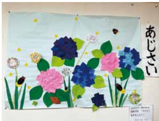
▲ミナミ・デイサービスの皆さんの作品