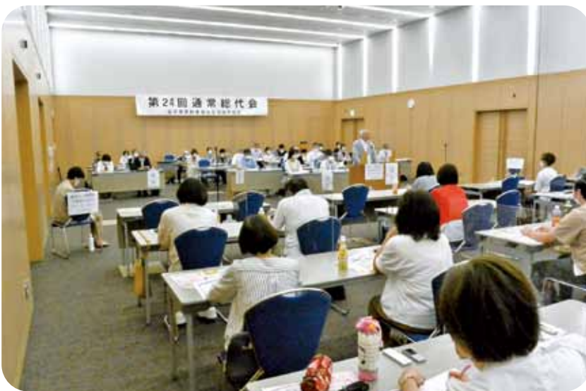
前回通常総代会の様子

社会のあり方を大きく変えた新型コロナウイルス感染症の世界的大流行から三年になります。いまだ収束見通しがたない状況が続いています。また、本年二月からはロシア軍によるウクライナ侵攻が強行され、人々の平和な暮らしが脅かされる事態が今もなお続いています。