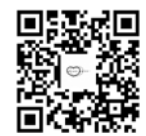
プレゼント企画HP QRコード