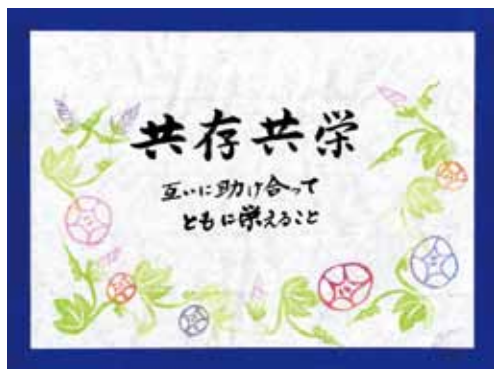
◀ほのぼの消しゴム版画作品 (版:加治美千代 字:鶴田輝子)