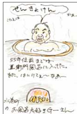
◀お風呂大好きGーさん(水巻町)