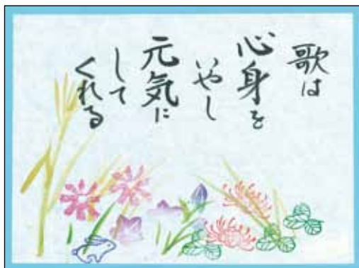
▲ほのぼの消しゴム版画作品(版:加治美千代 字:鶴田輝子)