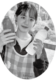
小さなことからコツコツと。一緒に始めてみませんか？(職員 O.M)

ラベルレスボトルにすることでプラスチック資源の節約にもつながりとてもサステイナブル(持続可能化)。