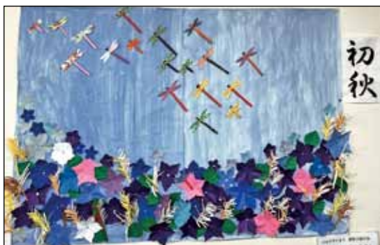
▲ミナミ・デイサービスの皆さんの作品