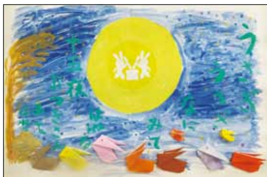
▲西南事業所宅老所「原さん家」の作品