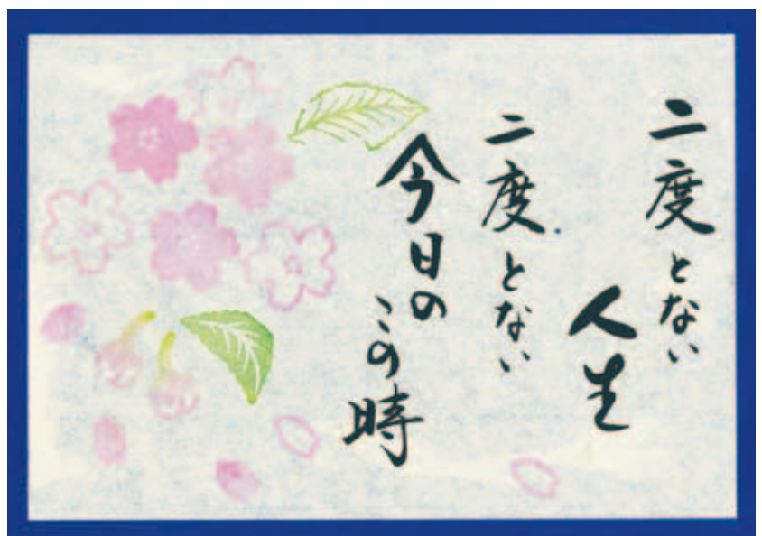
▲ほのぼの消しゴム版画作品(版:加治美千代 字:鶴田輝子)