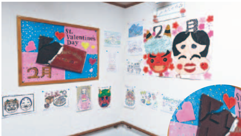
▲ふくし生協ひまわりの作品