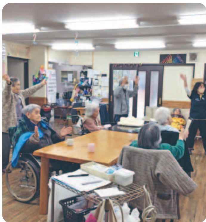
けいちく第3ほのぼの 体操レクのような

2023年度も、幅広い組合員の皆様から温かいご支援・ご協力がたくさんありました。心よりお礼を申し上げます。 2024年度は介護保険制度の改定と介護報酬改定が行われます。いずれも公費負担を減らし、利用者や事業所に負担を強いる内容となっております。今後も安心して利用できる介護保険制度を作る取り組みは重要です。組合員の皆様のご協力をよろしくおねがいします。 また、ふくし生協では2024年度から、介護記録システムの導入による記録業務の電子化や、働きやすい職場づくりをさらに進めていきます。また、ふくし生協が地域になくてはならない場所となるため、地域との交流や、社会保障への諸課題に対する運動を進めてまいります。